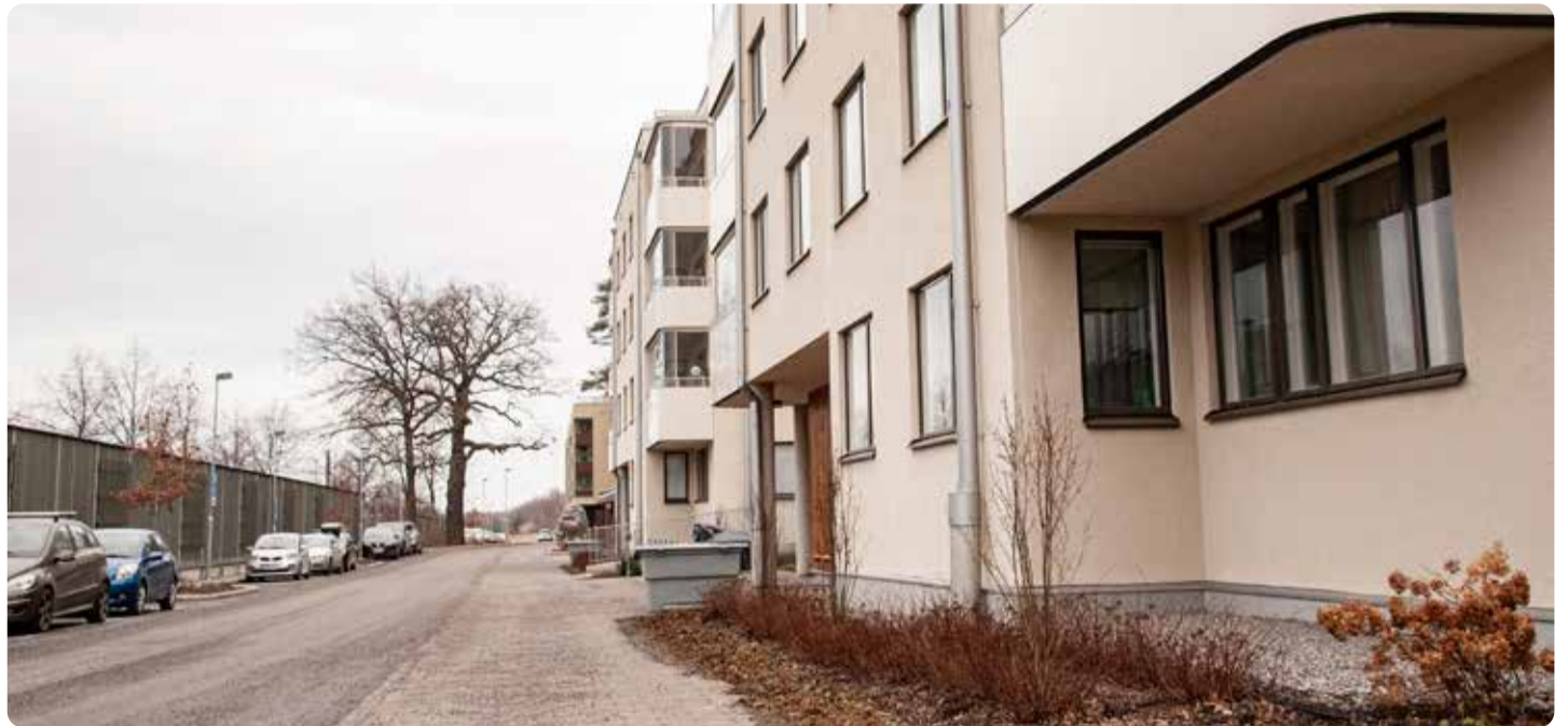
Grönt byggande. I Sverige finns en rad exempel på klimatvänliga projekt som finansierats med lån från Europeiska investeringsbanken, EIB. §