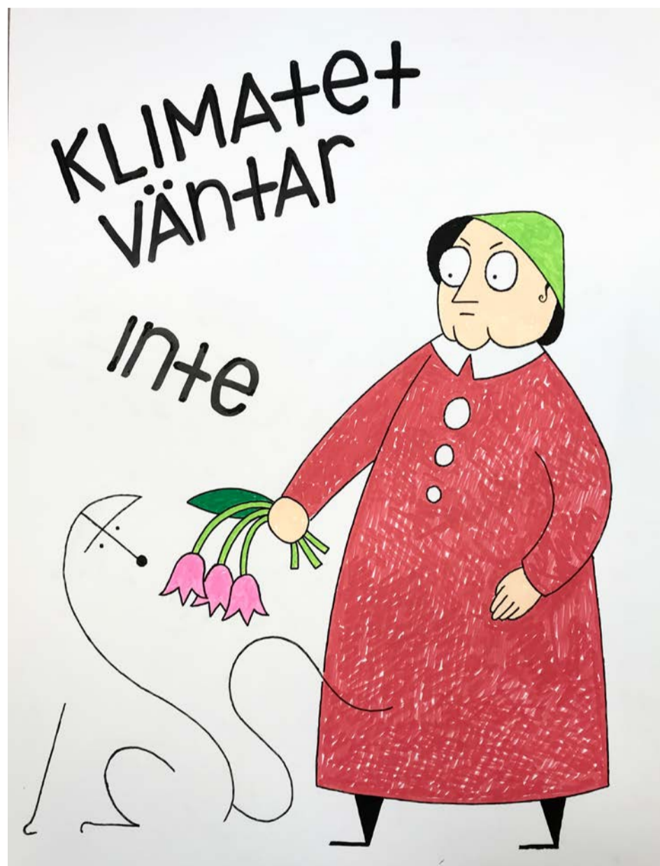
Illustration: Peter Ekström.

Tidigare politiska styren i Järfälla har haft ambitionen att arbeta i enlighet